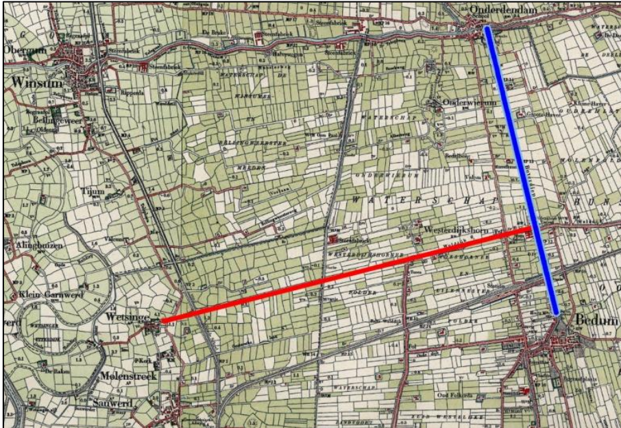
De oriëntatie van het Boterdiep-Noord is wellicht geconstrueerd met behulp van raailijnen op Wetsinge en de woonplek van Walfried

Wellicht is er een tijd geweest waarin het water noordwaarts via de Delthe op de Waddenzee werd geloosd, maar weldra veranderde de situatie en kon het water vanaf Onderdendam alleen in westelijke richting, via Winsum naar de gezamenlijke benedenloop van Hunze en Aa stromen.